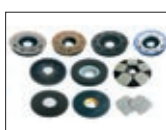
Ampia gamma spazzole e dischi